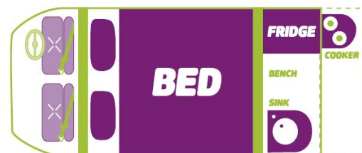
FLOOR PLAN NIGHT