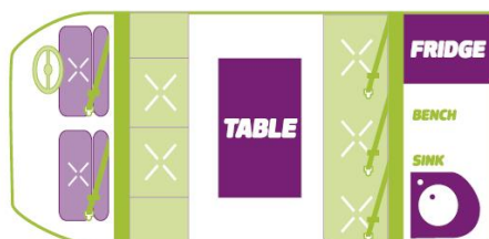
FLOOR PLAN DAY