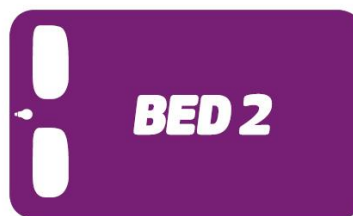
FLOOR PLAN PENTHOUSE